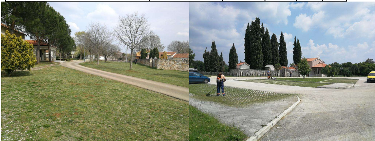
Tabela 4. Površine koje se kose leđnom motornom kosilicom (trimerom) u naseljima (ulice i prolazi)