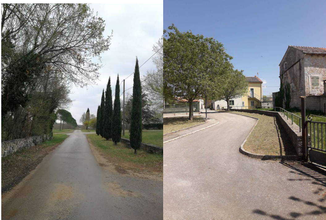
Tabela 3. Površine za košnju i održavanje na oko mjesnih groblji: