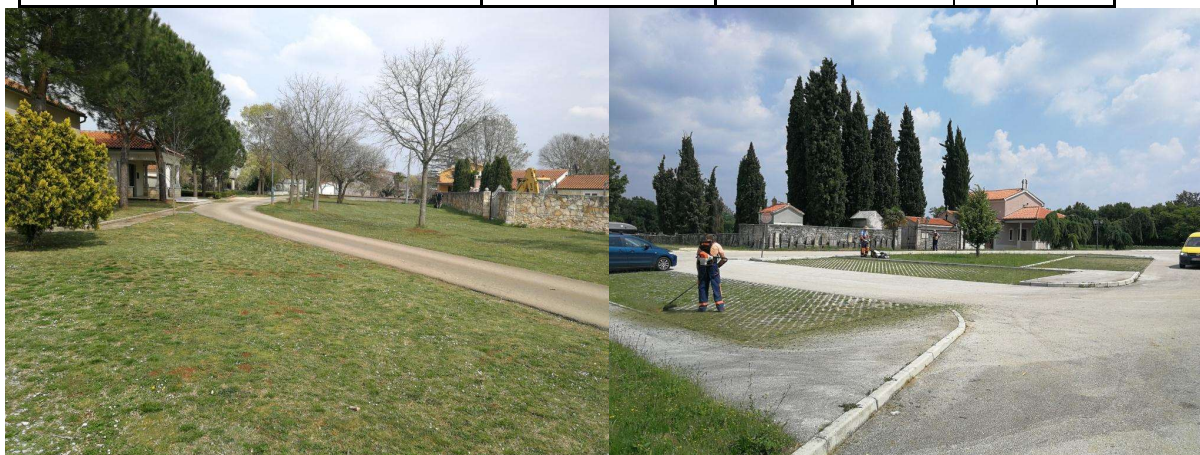
Tabela 4. Površine koje se kose leđnom motornom kosilicom (trimerom) u naseljima (ulice i prolazi)