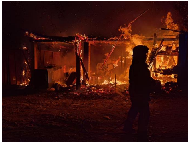
Detalji požara skladišta