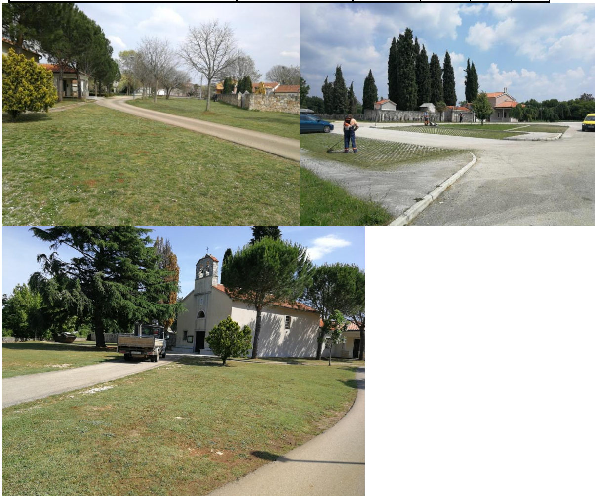
Tabela 4. Površine koje se kose leđnom motornom kosilicom (trimerom) u naseljima (ulice i prolazi)