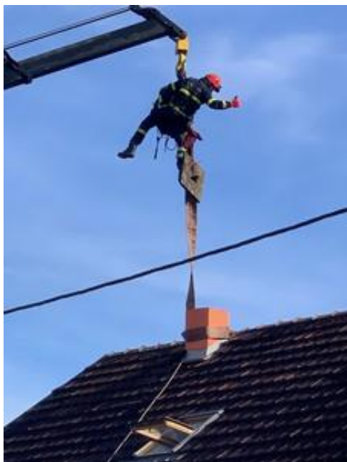
Detalj skidanja dimnjaka

moderno vatrogastvo zahtijeva, te su stekli i neprocjenjivo iskustvo za daljnji rad i napredovanje.