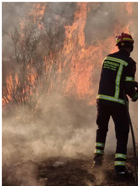
Detalji požara na području općina Bale

Ozbiljan i profesionalan pristup svakoj dojavi i intervenciji, te kvalitetna i redovita obuka profesionalaca i dobrovoljnih vatrogasaca rezultirale su izvrsnosti na samim intervencijama i daju nam za pravo da budemo glavni nosioci sustava Civilne zaštite na našem području.