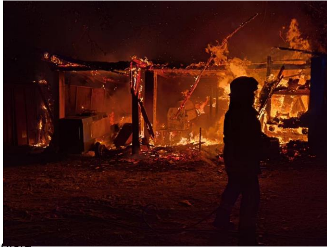
Detalji požara skladišta

dolasku nalazila u potpuno razbuktanoj fazi požara. Iako vrlo zahtjevni zbog gabarita i količine gorivog materijala i ove smo požare vrlo brzo stavili pod nadzor, lokalizirali i pogasili.