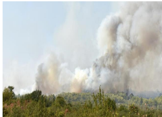
Detalji požara na području općina Žminj i Bale

Ozbiljan i profesionalan pristup svakoj dojavi i intervenciji, te kvalitetna i redovita obuka profesionalaca i dobrovoljnih vatrogasaca rezultirale su izvrsnosti na samim intervencijama i daju nam za pravo da budemo glavni nosioci sustava Civilne zaštite na našem području.