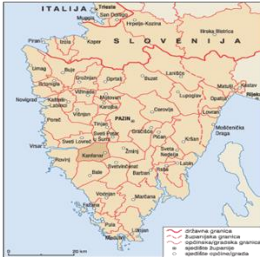
Slika 1. Položaj Općine Kanfanar u Istarskoj županiji