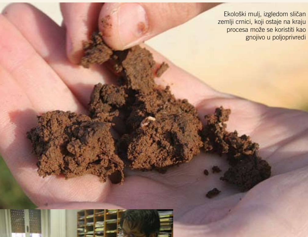
Ekološki mulj, izgledom sličan zemlji crnici, koji ostaje na kraju procesa može se koristiti kao gnojivo u poljoprivredi

Pročistač otpadnih voda za 21. stoljeće - Općina Kanfanar je prva lokalna samouprava u Istri koja je rješenje za otpadne vode našla u ovakvom modernom prečistaču. Postrojenjem će kroz neko vrijeme upravljati obučena osoba zaposlena u općinskom komunalnom poduzeću Limska draga