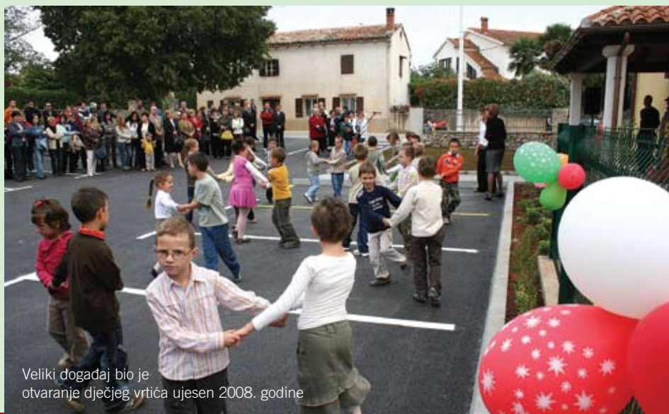
Veliki događaj bio je otvaranje dječjeg vrtića ujesen 2008. godine

Da bi sanirali "crne točke" na našim prometnicama, na kojima zbog neprilagođene brzine ima i stradalih, izrađena su idejna rješenja i idejni projekti raskrižja prilaza naseljima Okreti, Kurili i Šorići (time su stvoreni uvjeti za lokacijsku