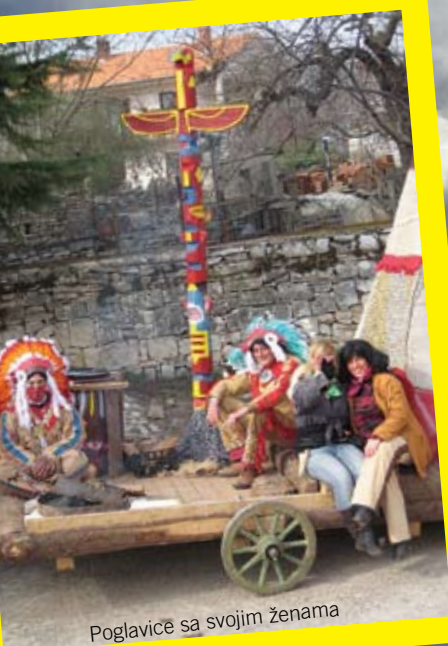
Poglavice sa svojim ženama