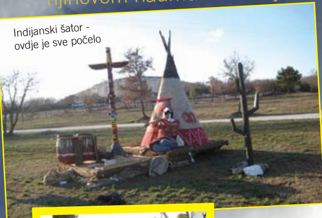
Indijanski šator - ovdje je sve počelo

Ovdašnji kaubojski sa svojim šerifima pomogli su Indijancima u njihovom naumu te su zajedno poharali Kuntradu