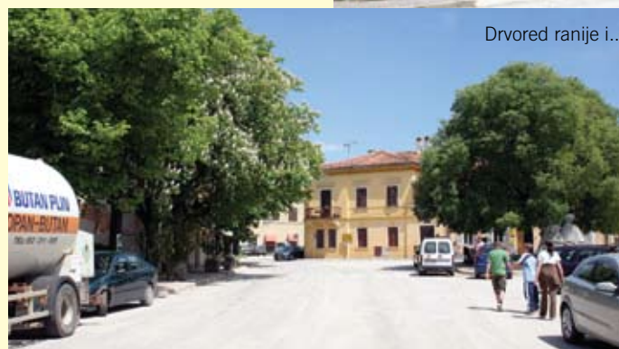
Drvored ranije i... nakon obrezivanja

drage Dalibora Bastijančića, drvored duže vrijeme nije bio održavan, a rezanje je uslijedilo nakon što su sa krošnji stabala počele otpadati grane, naročito u vrijeme kiša, pa je stanje procijenjeno opasnim. Na sreću nitko nije stradao.