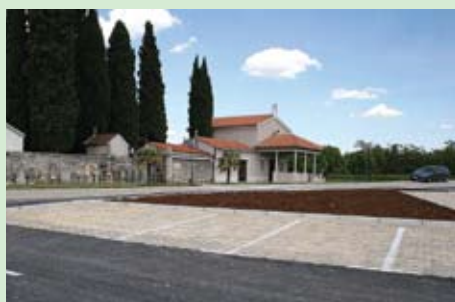
Izgrađeno je parkiralište groblja Kanfanar za stotinjak automobila