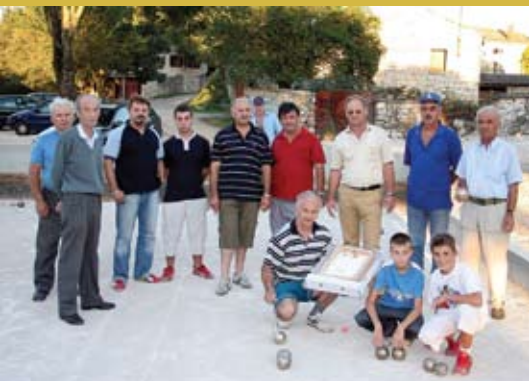
Proslava izgradnje novog bočališta u Mrganima

dobila i nova vrata i čelne stijene ulaza, a obnovljen je i krov škole u Kanfanaru koji je prokišnjavao.