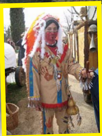
Indijanski poglavica Rino koji tupi (pseudonim: Bik koji ne sjedi)