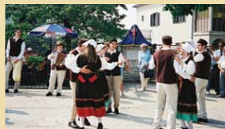
Folklor - jedna od aktivnosti mladih u Kanfanaru

(Sanjin Dimić Boljunčić u "Kanfanarskom listu" br. 6, srpanj 2002.)