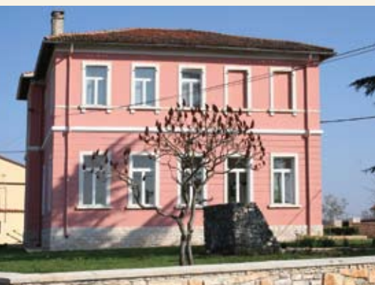
U školi u Sošićima uredene su sanitarije

Za javne potrebe u predškolskom obrazovanju Općina će izdvojiti 720 tisuća kuna, za školstvo, stipendije i školarine 260 tisuća, a za sport oko 550 tisuća, od čega je za uređenje sanitarija na kanfanarskom nogometnom igralištu namijenjeno 85 tisuća kuna. Za kulturu je planirano oko 780 tisuća kuna, od čega će 200 tisuća biti potrošeno za Jakovlju, a 250 tisuća za sanaciju Dvigrada.