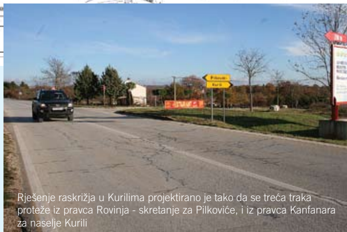
Rješenje raskrižja u Kurilima projektirano je tako da se treća traka proteže iz pravca Rovinja - skretanje za Pilkoviće, i iz pravca Kanfanara za naselje Kurili

Sva su raskrižja, kako nam je pojasnio i sam načelnik Anton Modesto, na državnoj cesti D-303 na dionici Kanfanar-Rovinj. Zbog stalnog porasta prometa na toj prometnici i uvida u postojeće rješenje koje ne udovoljava sigurnosti izlaska i ulaska "motoriziranih" stanovnika tih naselja na glavnu državnu prometnicu, Općina Kanfanar je pokrenula izradu idejnog rješenja a potom