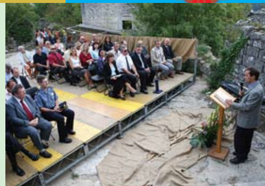
Nakon više od tristo godina kanfanarsko Vijeće je sjednicu održalo u Dvigradu