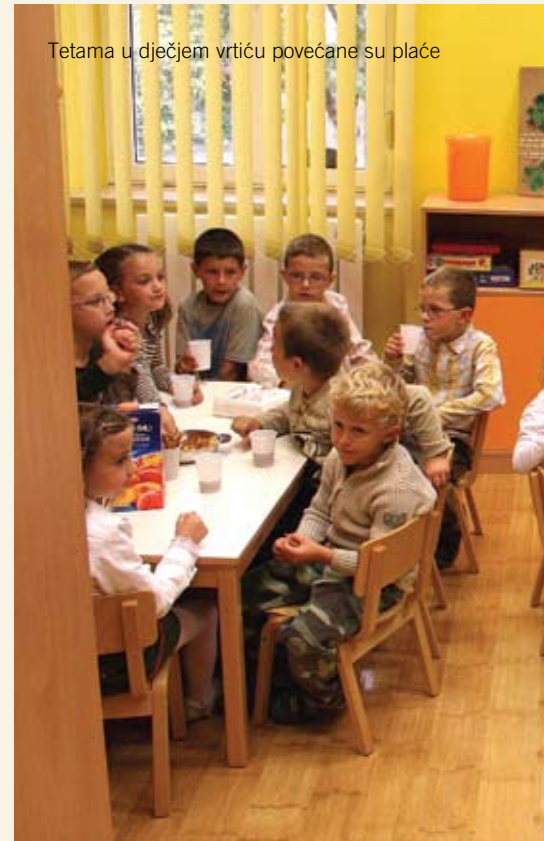
Tetama u dječjem vrtiću povećane su plaće

površina na području Općine Kanfanar napravljen prijedlog Ugovora, kojom je definirano da se može davati kiosk, svaka privremena i montažna baraka u kojoj se obavlja poslovna djelatnost. U Ugovoru su definirane katastarske čestice koje se daju na privremeno korištenje, 4000-5000 m 2 , definirana je cijena od 15.000 kuna mjesečno, te rok od godine dana. Troškove