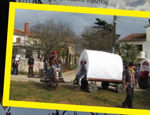
Pohod po Kuntradi malokoga je ostavio trijeznog