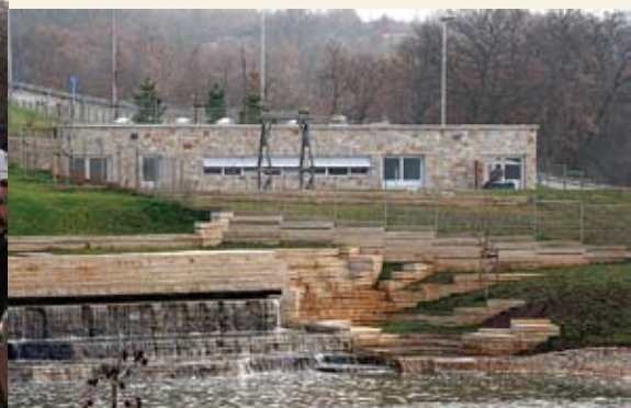
Voda poslije prečistača odlazi u jezero i iz jezera se crpi kao tehnološka voda

U povodu Svjetskog dana voda kanfanarskim vijećnicima i uzvanicima predstavljen je uređaj za pročišćavanje otpadnih voda industrijske zone, na koji će se po dovršetku kanalizacije priključiti i Kanfanar te okolna naselja. Najvrjednija općinska komunalna investicija u proteklom mandatu, prečistač otpadnih voda, dalekosežno je rješenje i za industrijsku zonu Kanfanar i za okolna naselja. Ekološka sabirnica svega otpada nalazi se u malom postrojenju unutar industrijske zone u vlasništvu Općine Kanfanar. Ničime, pa ni mirisom, ne odaje da se ovdje odvija proces razgrađivanja tvari kojih bi se najradije riješili.