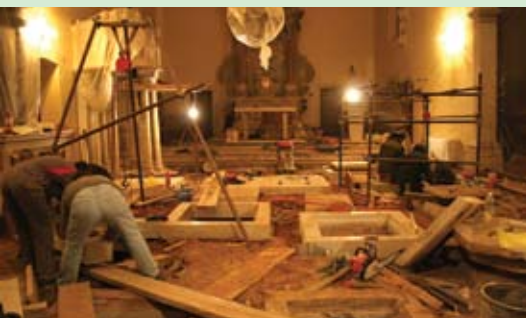
Obnovljen je pod župne crkve u Kanfanaru

Dosta se ulagalo i u groblja, što je nekima i smetalo, no to su obveze svake lokalne vlasti i za to postoje sredstva. Izgrađeno je tako parkiralište groblja Kanfanar, izgrađen je trotoar i potporni zid od Kanfanara do groblja Kanfanar. Uz groblje u Dvigradu