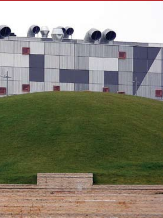
na industrijska zona na području Istarske županije

alnoj infrastrukturi, o kakvima druge općine mogu samo sanjati