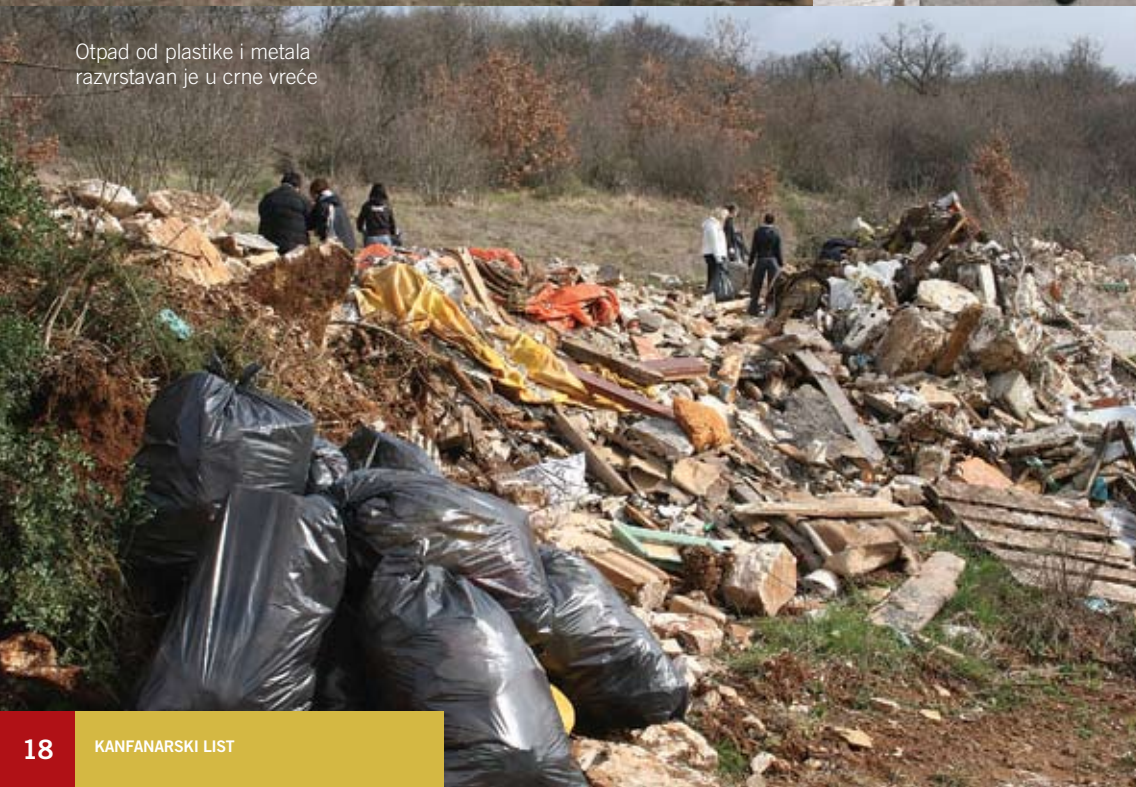
Otpad od plastike i metala razvrstavan je u crne vreće

je mještana da se očišćena površina prekrije zemljom te da se uz lokvu postave klupe za odmor.