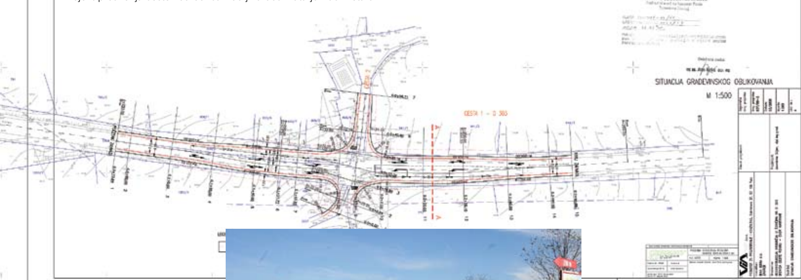
Projekt proširenja ceste kod Šorića - duljina obuhvata je 160 metara

Kao što smo i najavili u novogodišnjem broju Kanfanarskog lista, u izradi su idejni projekti prometnih površina za raskrižja u Okretima, Šorićima i Kurilima. Hrvatske ceste zainteresirane su za izradu proširenja, odnosno trećih traka kod tih naselja, pa su dostavile ponudu za idejne projekte za izgradnju čvorišta, a temeljem njih sklopit će se sporazum s Općinom o obvezama u toj investiciji.