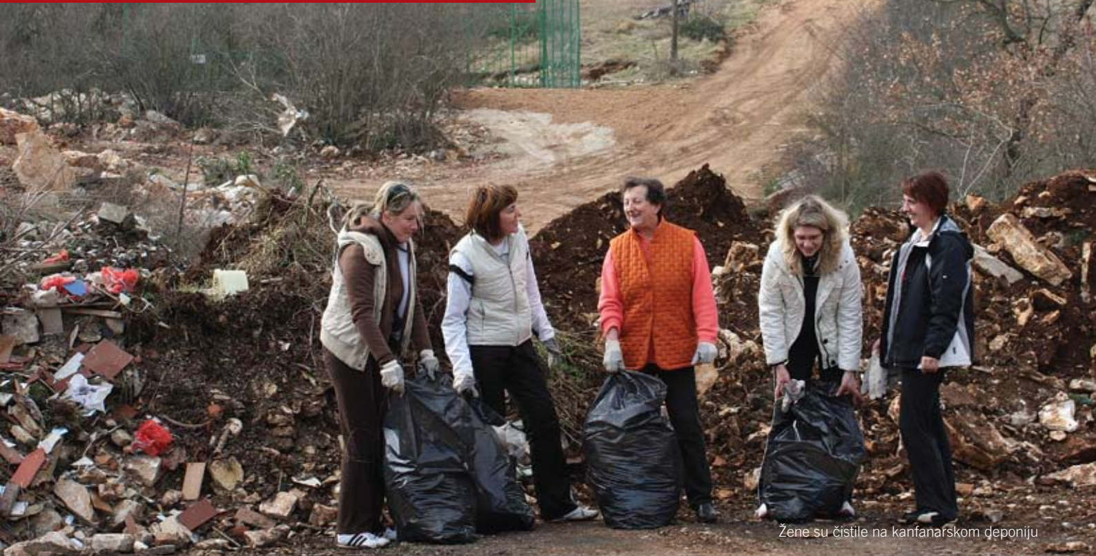
Žene su čistile na kanfanarskom deponiju