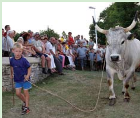
Ove godine 19., a sljedeće 20. godišnjica obnovljene Jakovlje

Općina naročito drži do održavanja spomenika antifašizma i pomoći aktivnostima udrugama antifašističkih boraca i udrugama i aktivnostima domovinskog rata.