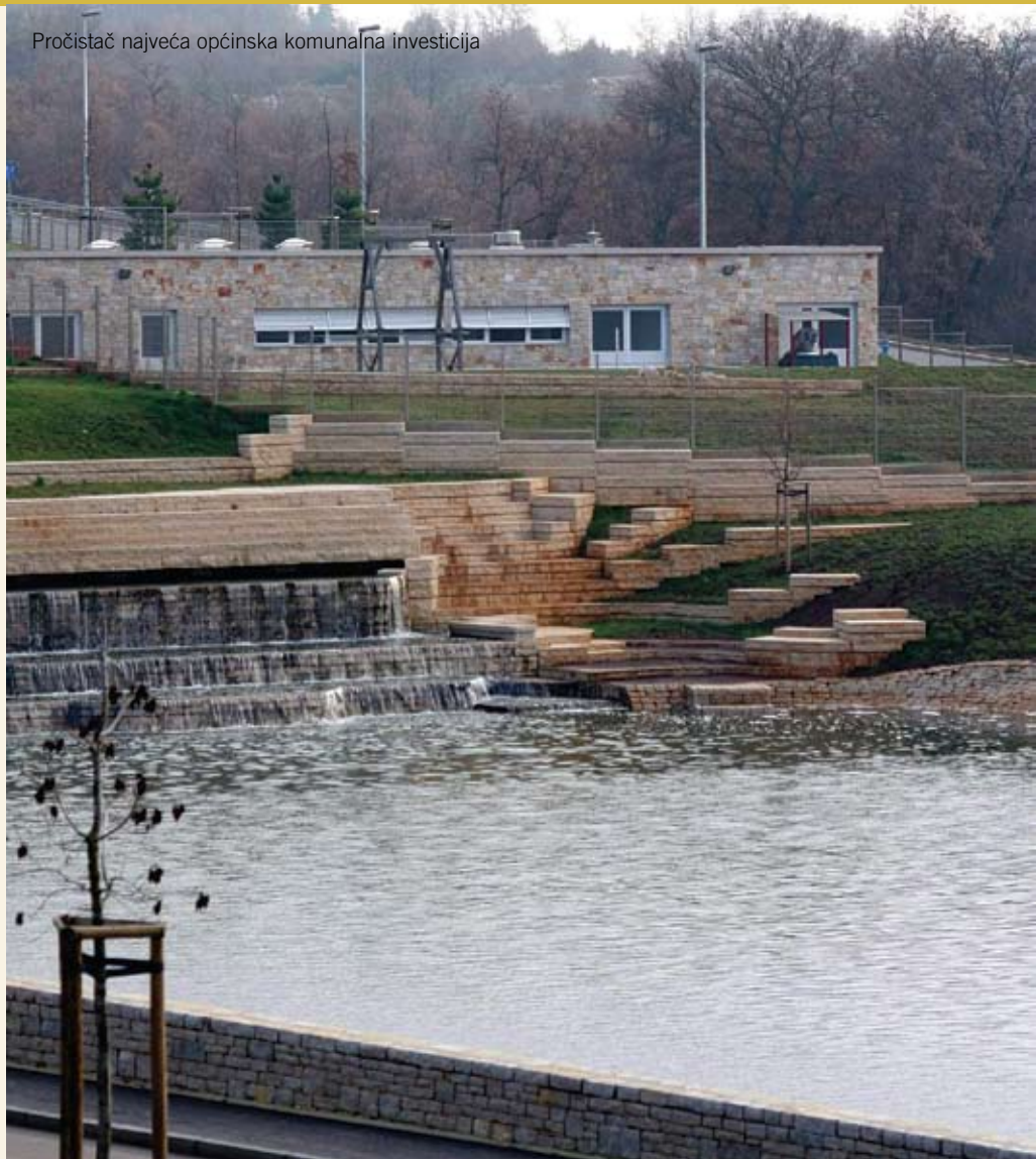
Pročistač najveća općinska komunalna investicija