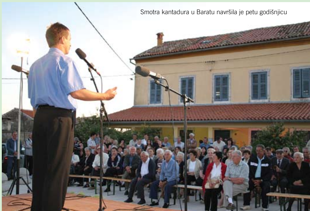
Smotra kantadura u Baratu navršila je petu godišnjicu

Briga je vođena i o socijali, na koju otpada znatan dio općinskoga Proračuna. Tradicionalno se dodjeljuju novogodišnji i uskršni bonovi i paketa: umirovljenicima, osobama staračko- poljoprivrednih domaćinstva i nezaposlenima. Dodjeljuju se božićni paketi djeci od 2 do 11 godina, a povećana je i naknada - novčana pomoć kod rođenja djeteta. Općina sufinancira smještaj djece predškolske dobi u vrtiću, kao i prijevoz učenika srednjih škola. Općina sufinancira nabavku invalidskih pomagala teško bolesnim i invalidnim osobama.