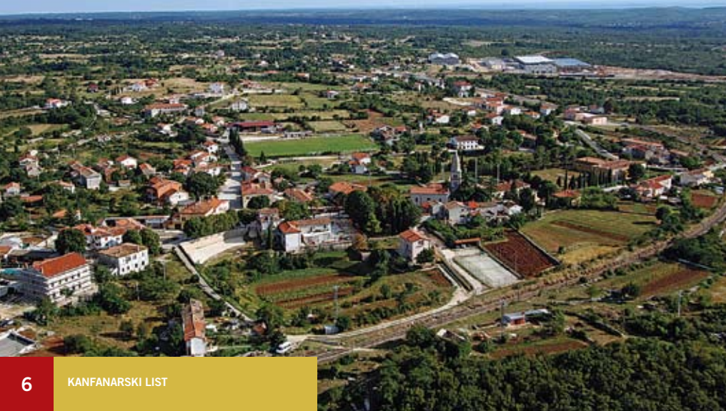
Panorama Kanfanara, u pozadini TDR u izgradnji

Od infrastrukturnih radova u školstvu, Općina je obnovila sanitarije škole u Sošićima, obnovila krov dvorane škole u Kanfanaru te u istoj ugradila nove prozore. Prethodno je saniran strop dvorane koji se bio jako nagnuo te nije bilo moguće izvoditi nastavu odnosno tjelovježbu. Škola je