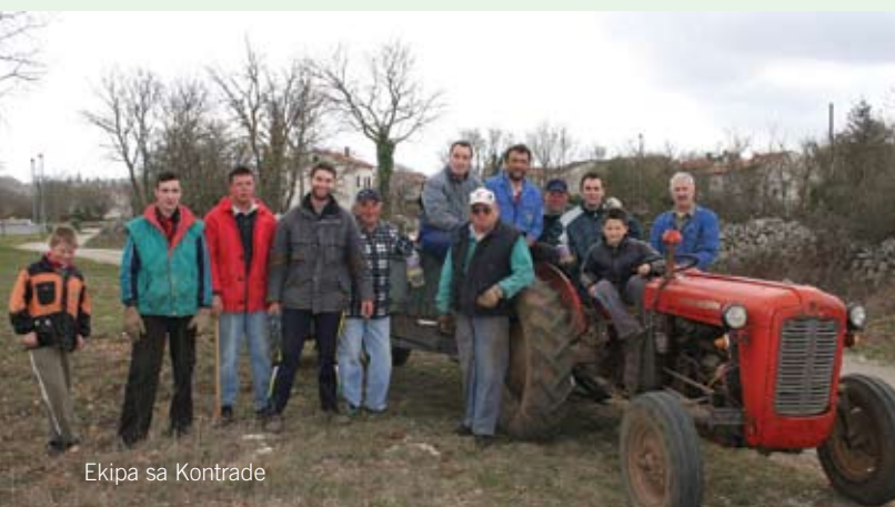
Ekipa sa Kontrade