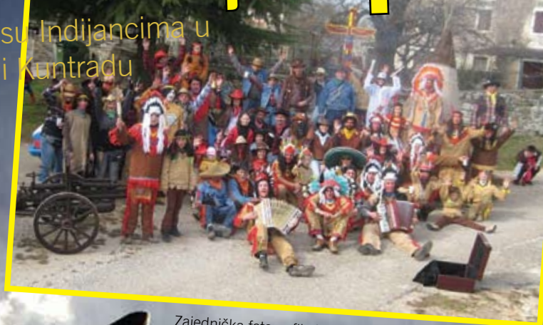
Zajednička fotografija kaubojaca, šerifa i indijanaca u opustošenim Brajkovićima