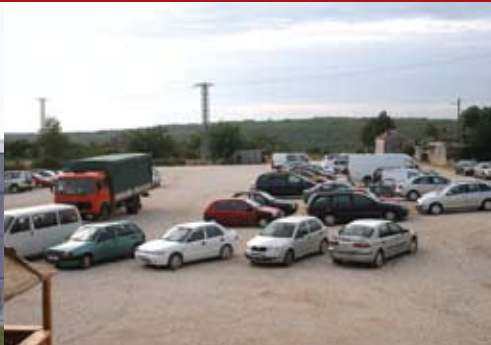
Na mjestu nekadašnje Vale uredeno je parkiralište u samom centru Kanfanara