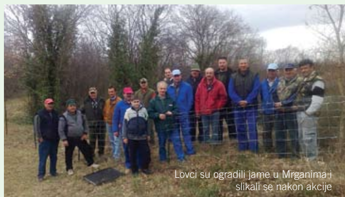
Lovci su ogradili jame u Mrganima i slikali se nakon akcije

Kao i svakog proljeća proteklih godina tako i ove, lovci lovačkog društva "GOLUB" Kanfanar krenuli su sa radovima uređenja lovišta, no ove godine priključivši se ekološkoj radnoj akciji koju je u subotu 28.03.2009. pokrenula općina Kanfanar.