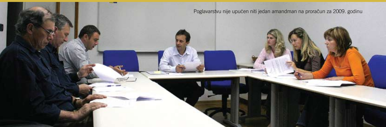
Poglavarstvu nije upućen niti jedan amandman na proračun za 2009. godinu

Godišnji Proračun Općine Kanfanar za 2008. godinu ostvaren sa 93,48 posto • Općinski