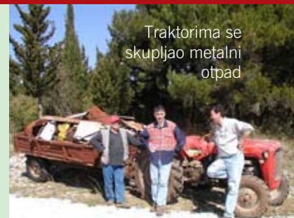
Traktorima se skupljao metalni otpad

U Prikodrugi akcije su se odvijale u naseljima Jural, Korenici, Ladići i Barat. U Juralu se sakupljao uglavnom