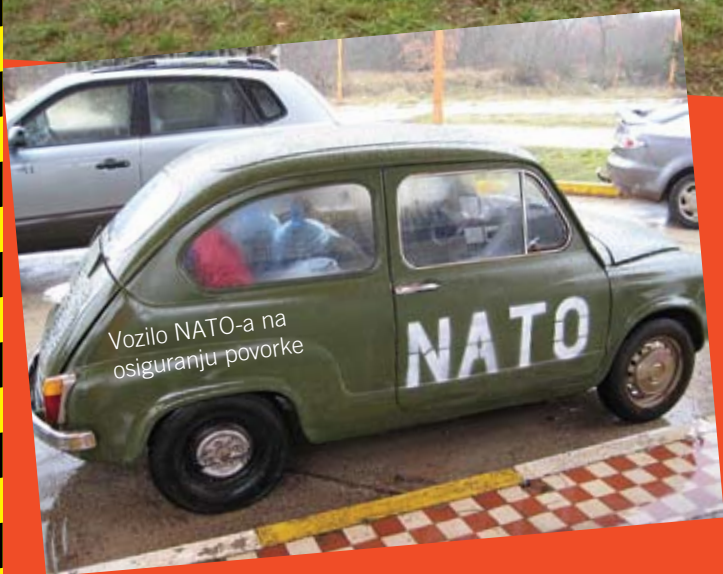
Vozilo NATO-a na osiguranju povorke