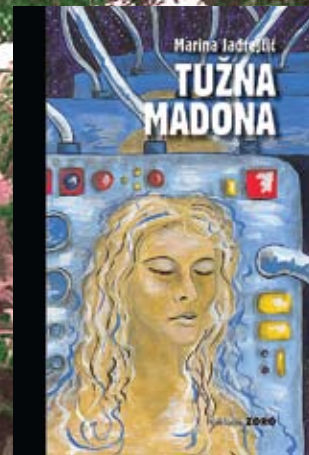
Naslovnica knjige Tužna madona