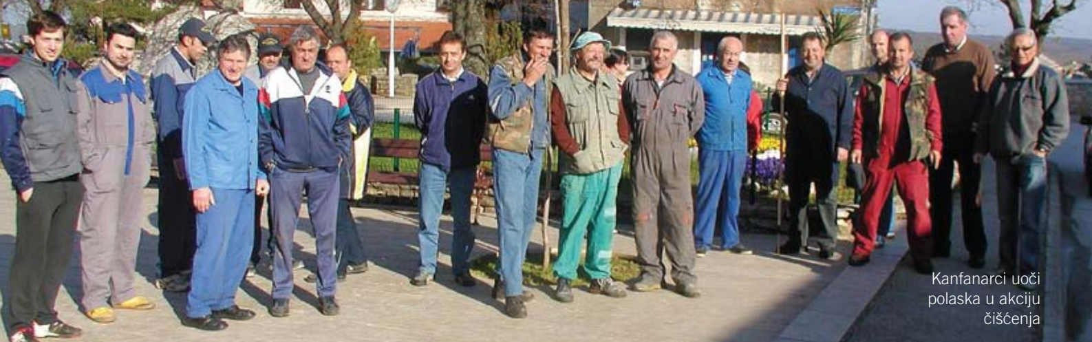
Kanfanarci uoči polaska u akciju čišćenja

U dvije subote (29. ožujka i 5. travnja), koliko je trajala akcija, angažirano je više od 80 ljudi, na osam različitih lokacija. Sakupljene velike količine otpada