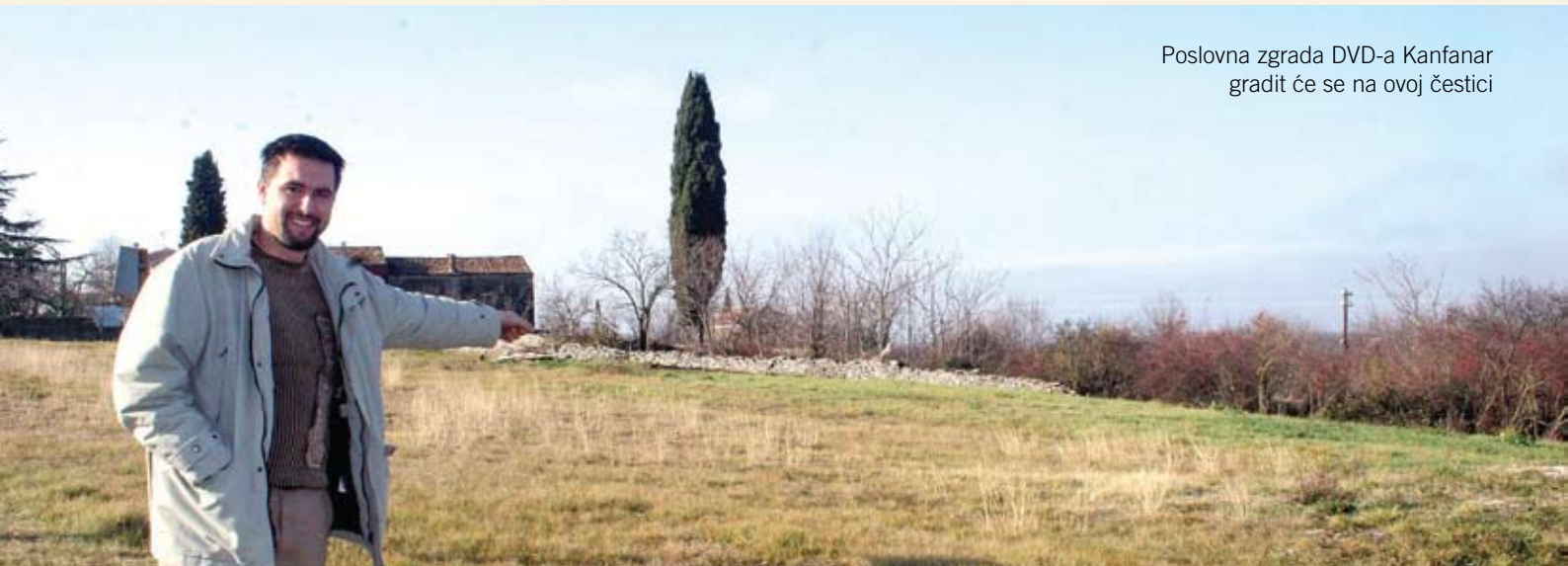
Poslovna zgrada DVD-a Kanfanar gradit će se na ovoj čestici