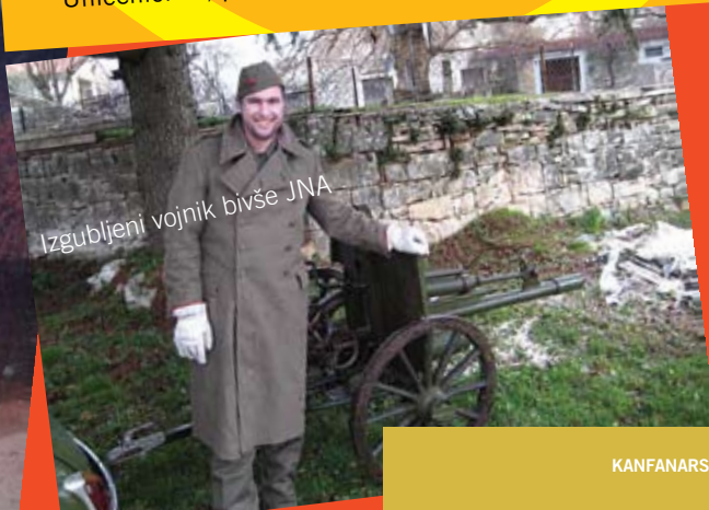
Izgubljeni vojnik bivše JNA